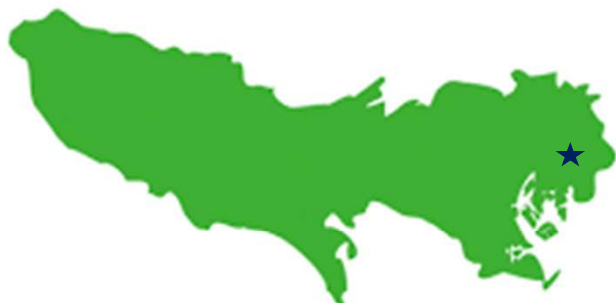
押上 (東京スカイツリー)