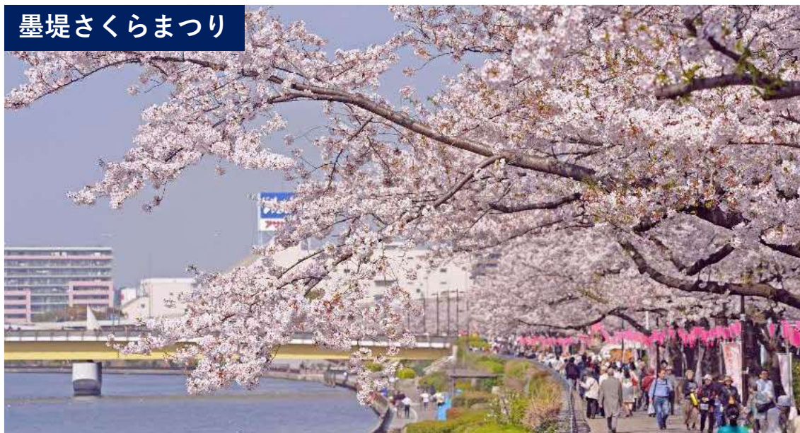
墨堤さくらまつり