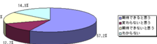
2-1 駅周辺整備による街の発展

JR線高架完成後に、周辺住民、鉄道利用者 にアンケート調査を実施したところ、約6割の方 々から、「今後のまちの発展に期待できる」と回 答がありました。